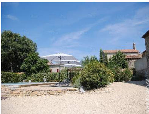
从附属物处看到的景象