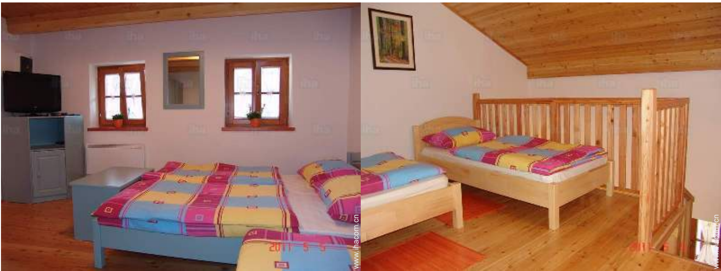
卧具 - 床