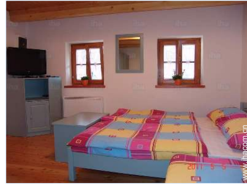
卧具 - 床